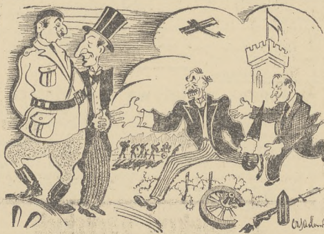
Daladier i Chamberlain przyszli do przekonania, że gen. Franco może być uznany „de iure”.