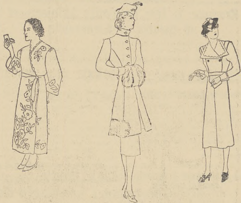
Szafrok, zakłzet trzykwartowy, praktyczna sukienka na codzienną — przerobione ze starych niemodnych płaszczaków.