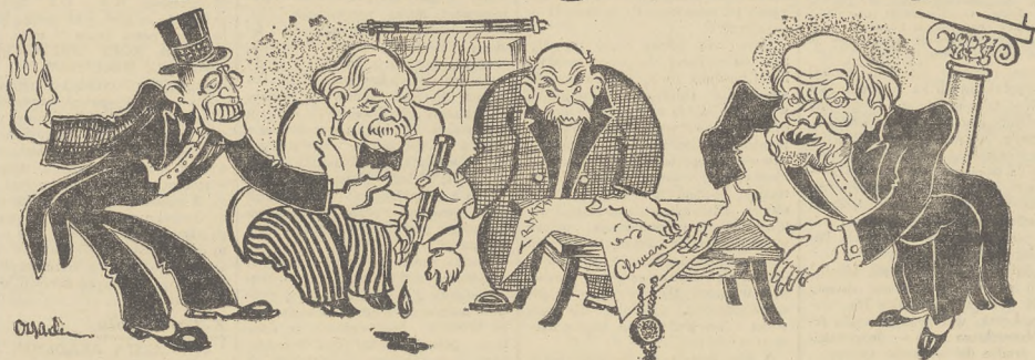
Zebrał się w Wersalu (1919); przysięgali; podpisali; zagwarantowali.