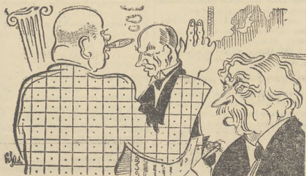
Obejrżeli Locarno (1926) podpisali, zagwarantowali.