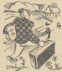
JUDYM „WALI” NA WIEŚ

Rekord pobił jednak Molier, który w całym swoim niestudowanym aktorskim życiu z pasją nagrywał się z lekarzami. Największe zalety zawodu lekarskiego — mówił — jest to, że nieboszczyki to ludzie niezrównanej wprost uprzejmości i dyskrekcji, i jeszcze nikt nie słyszał, aby się któryś pokrzyżował na lekarza, który go sprzątał.