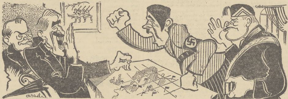
Zebrał się w Monachium (1938); przysięgali; podpisali; zagwarantowali.

SCENA MALŻENSKA On: „Z tobą to ja nigdy nie mam racji!” Ona: „Ach, nie. W zeszłym tygodniu ty miałeś rację”. On: „Kiedy?” Ona: „Kiedy powiedziałeś, że nie masz racji!” ZEZ I MOTORYZACJA Prowadząc pełnym gazem wspaniały samochód, pewien zadowolony młodzieniec o mało nie przejechał jakiegoś przechodnia. Wściekły, strofując niedołą ośiarę motoryzacji kraju: — Ei! Nie możesz pan patrzeć, gdzie idziesz? A przechodzinca: — A ty, petaku, nie możesz jechać tam, gdzie patrzysz?