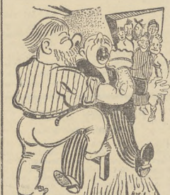
ZNACHOR - DENTYSTA

nawcze do rozporządzenia Prezydenta R.P. z dn. 30. VII. 1938 o wykonywaniu praktyki lekarskiej. Młodzi lekarze prowadzą na wies... Będzie to rezultatem wielkiej burzy, jaka z dużym hukiem przewalała się przez szpalty niektórych gazet i przez dłuższy czas „szalała” w Sejmie. Ostatecznie „stało” na tym, że po studiach lekarz musi odbyć jednoznaczny staż w jakimkolwiek szpitalu, potem dwa lata musi praktykować w gminie wiejskiej, lub w mieście powyżej 5.000 mieszkańców, a o obowiązku tego może być zwolniony tylko wówczas, jeżeli od był 5-letnią służbę wojskową, albo zobowiąże się, że przez 5 lat poświęci się studiom teoretycznym, lub praktycznym na warunkach etatowych w za-