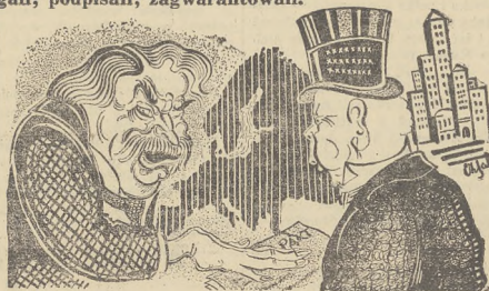
Świadczył Kellog, świadczył Briand (1928).