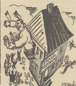
LEKARZ REJONOWY WYDAJE RECEPTY

Zdaje się, że nie ma tak poważnych argumentów, któreby mogły powstrzymać młodych lekarzy od pójścia na wies. Nie można przecież poważnie brnąć krytycznych uwag niektórych (Dalszy ciąg na str. 9-10)