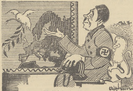
Słodki jest pokój

SCENA MALŻENSKA On: „Z tobą to ja nigdy nie mam racji!” Ona: „Ach, nie. W zeszłym tygodniu ty miałeś rację”. On: „Kiedy?” Ona: „Kiedy powiedziałeś, że nie masz racji!” ZEZ I MOTORYZACJA Prowadząc pełnym gazem wspaniały samochód, pewien zadowolony młodzieniec o mało nie przejechał jakiegoś przechodnia. Wściekły, strofując niedołą ośiarę motoryzacji kraju: — Ei! Nie możesz pan patrzeć, gdzie idziesz? A przechodzinca: — A ty, petaku, nie możesz jechać tam, gdzie patrzysz?