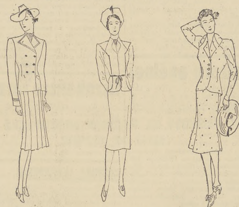
1) Kostium sportowy z granatowego samodzielnego płaszczyka spodni. — 2) Czarna kostium z poszerzoną u dołu spodni. — 3) Gaszonka z grubszego materiału, doskonale zastępująca kostium.