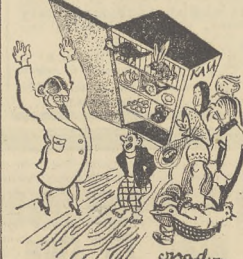
HONORARIA W NATURZE

Za kilka dni, przed pierwszym wykładem, wyjdzie rozporządzenie kwot-