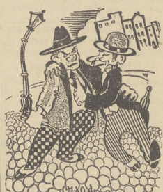
...Gdy pijesz napój wyskokowy płać podatek F. O. N-owy