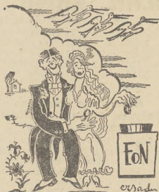
...Obrączki złote na powietrzną flotę...