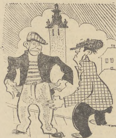
...jako: „jak ni masz co złoty humor swój daj...”