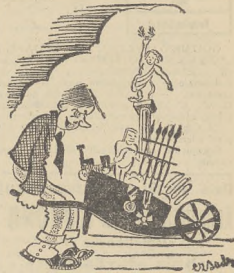
...Żelazne graty na armaty..

„Próżny znój Mężu mój... Ściany tu Gole już. Dalam flet Na ten cel. Złoto z rąk Ma już F. O. N. Smutki me I złotych sześć — Sej na tę rzecz Dalam też. Cóż więc dam Powiedz sam?” Rzeczce on: „Zgodny sąd Łączy nas! Póki czas Buzi mi dasz! To nie F. O. N. To prosz... mał”.