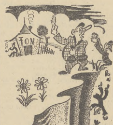
...Kto pod F. O. N-em dotki kopie, sam w rów wpada...