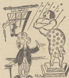
...Oddaję to, co mam najdroższego...