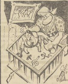
— Taci jestem mali i oklazoni