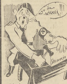
— A my cudzymi interesami. pa nie kanclerzu nie handlujemy..