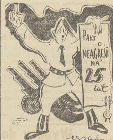
Dobry żart — tyńfa wart!