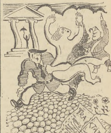
Sen pana kanclerza: Porwanie Euro-py