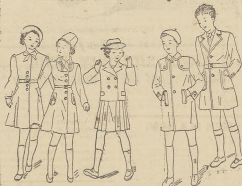
Modny płaszcz dla dziewczynki w kolorze różowym. — Płaszcz akademicki, szelono wany. — Sztywony kostiumik z materiału w drobny kratkę. Spódniczka plisowana. — Płaszcz dla chłopca z nakładkami karzełkami. — Płaszczyk z diagonalą.