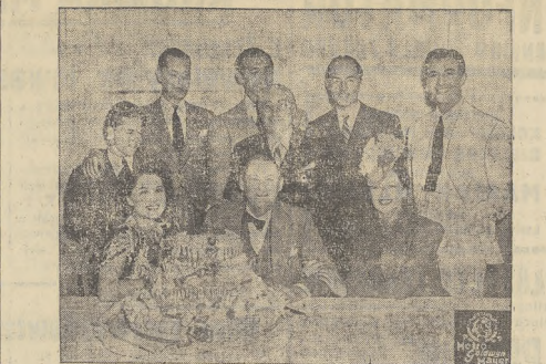
Uroczyste obchodzone w Hollywood 61 rocznicę urodzin Lionela Barrymore. Na zdjęciu widzimy: Normę Shearer, solenizanta, Rosalind Russel, Roberta Taylora, Williama Powella, Louis B. Mayera, Clarka Gable, Roberta Montgomery, Mickey Rooney.