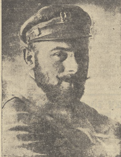
Mjr Edward Śmigły-Rydz