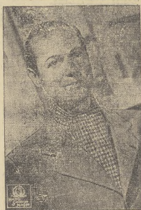
Ulubieniec publiczności kinowej, Robert Montgomery.

blicznej wiadomości, jest zwapnieniem uległą części pnia drzewnego, ludzko imitującą kształtem kiel mamuta.