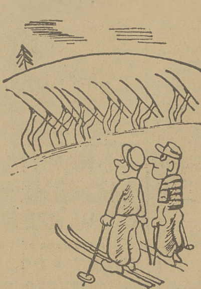
Odmiana najnowszego baletu... na śniegu.