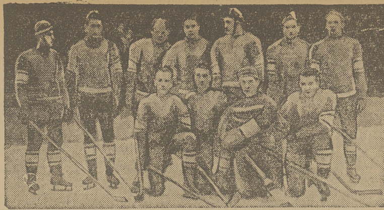
Polska drużyna hokejowa na lodowisku w M. Ostrawie przed meczem z Włt. Zelezarny, który przyniósł jej zwycięstwo 9:6.