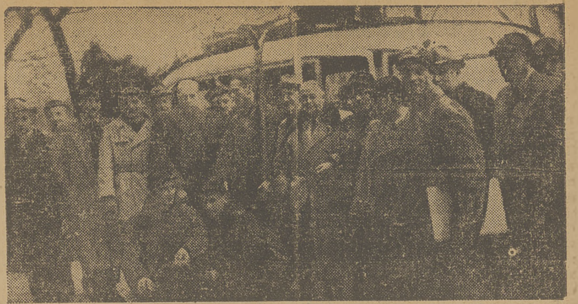
Narciarze są pierwszymi naszymi olimpijczykami, którzy opuścili Polskę by reprezentować nasze barwy na Olimpiadzie zimowej w St. Moritz. Na zdjęciu widzimy ich w otoczeniu przedstawicieli władz oraz prasy przed odjazdem z Krakowa w ub. piątek.