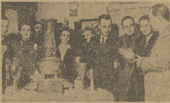
W chwili uroczystego przejmowania ich od przewodniczących.