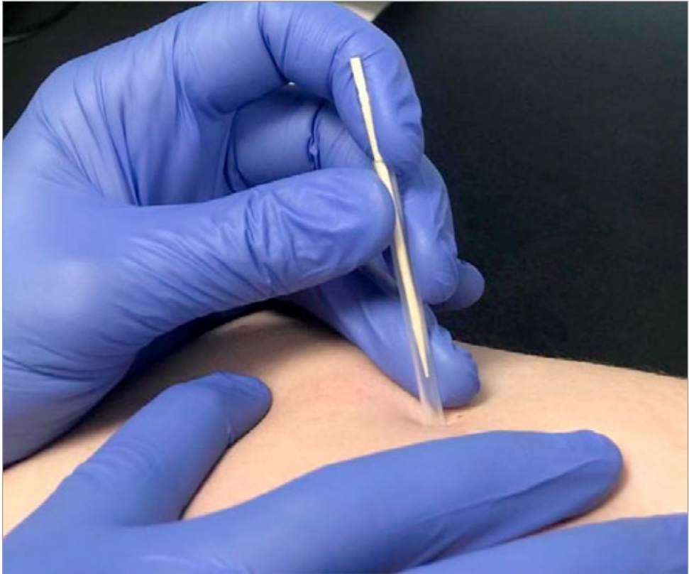
Rycina 2. Przykład aplikacji pozorowanej suchego igłowania wykorzystujący przewodnicę igły właściwej i wykałaczkę [55]

nywane aplikacje igłowe na aktywnych punktach spustowych raz w tygodniu przez okres 6 tygodni. W grupie zabiegów pozorowanych próbie ślepej uzyskano przez zastosowanie wykałaczki wprowadzonej do przewodnicy igłowej i za jej pomocą dokonywano stymulacji punktów skórnych rzutowanych nad TrP (ryc. 2). Badania te nadal trwają, więc na analizę uzyskanych wyników trzeba jeszcze poczekać.