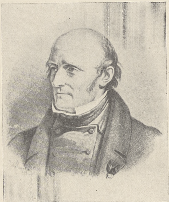
Pehr Henrik Ling