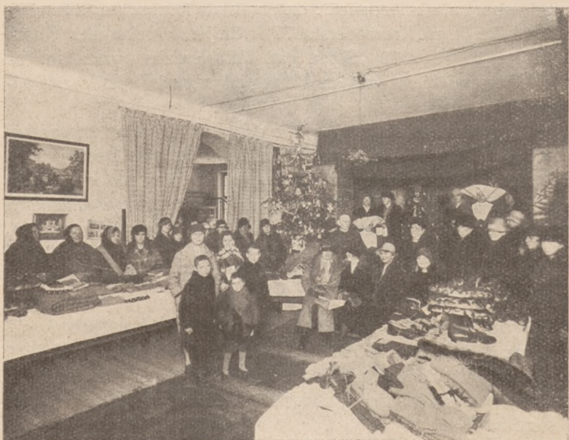
Ubodzy w czasie „Gwiazdki“ r. 1928.