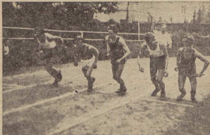
W ramach przygotowań do spartakiady na wszystkich stadionach szkolnych odbywały się eliminacje lekkoatletyczne.