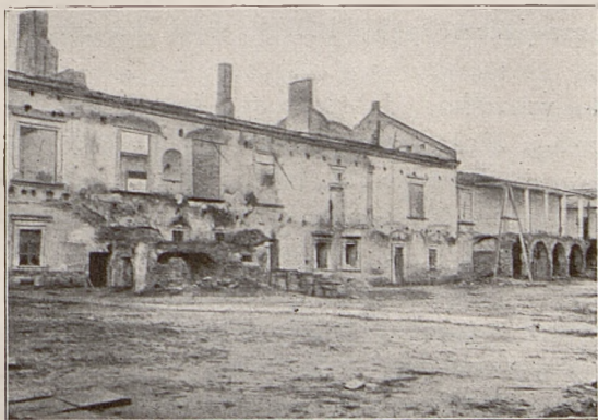
Fig. 6. Zamek w Żółkwi.

dzać musiano z odległych stron za wysoką stosunkowo opłatą, musiano pomyśleć o innym wątku budowlanym. Niekiedy też względy na ogniotrwałość domostwa wskazywały wznosić budynek murowany a nie drewniany. Weszła z nowymi materiałami budowlanymi do wsi polskiej sztuka budowlana, której nie znali wiejscy majsterkowie. Zabrakło wsi w tej przełomowej chwili wiejskiego murarza, któryby umiał przetransponować pomysły dawnych budo-