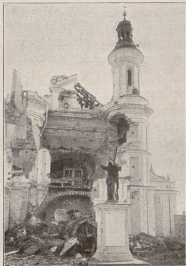
Fig. 8. Kościół w Wysokiem Kole.

dy spoczęli na polskiej ziemi, groby ich otoczmy należnym im szacunkiem. Spoczęli wśród nas, ziemia polska ich przyjęła, nasze drzewa nucić im będą hymn nadziei i zmartwychwstania, a lud nasz, przechodząc mimo, nie zapomni