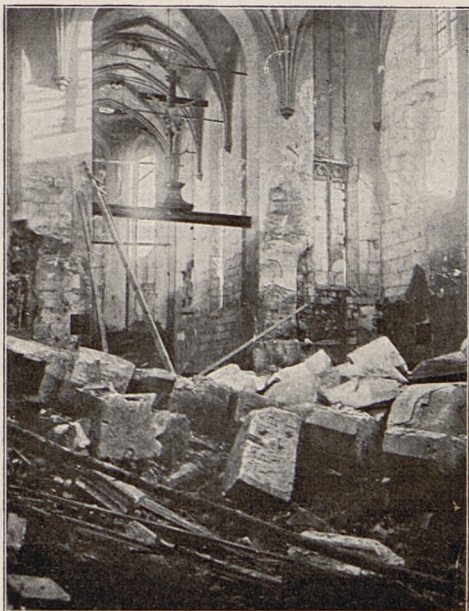
Fig. 2. Kolegiata w Wislicy (Stan dzisiejszy).

Gdyby obecna wojna przywróciła wszystkim narodom prawo samoistnego bytu i rozwoju indywidualnego, byłoby to jedyną trwałą jej korzyścią i historia po dziesiątkach