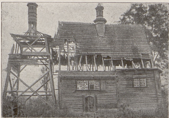
Fig. 5. Kościół w Sękowej.

W imię naszej kultury, jak również ze względów ekonomicznych, musimy wypowiedzieć walkę bezwzględną eternitowi, który nawet Podhale i samo Zakopane oszpecać zaczyna, gdyż wartość jego ogniotrwałość jest fikcją. Przeciwnie w razie pożaru eksplodując, przyczynia się do szerzenia klęski.