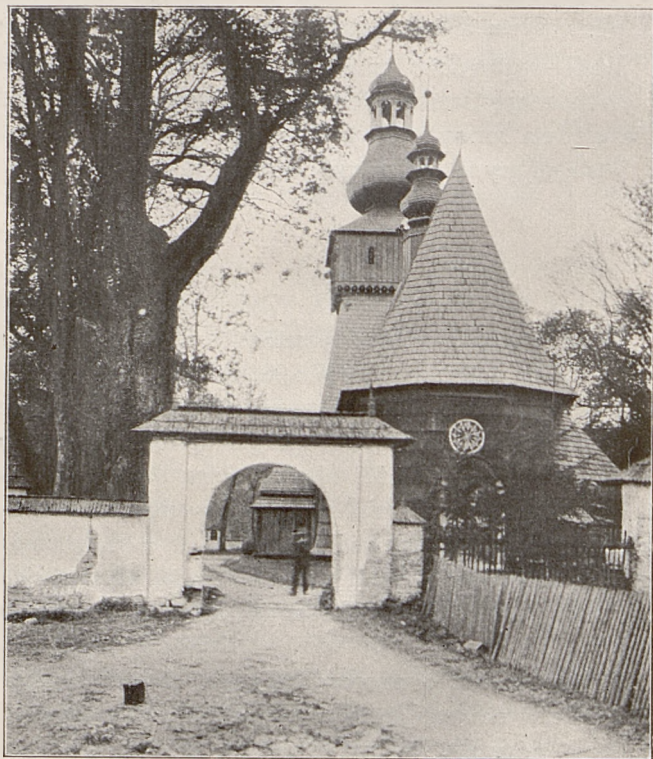
Fig. 9. Kościół w Rabce.

wiele, jakby się wydawało, patrząc na tę straszną falę wojenną, która miejsce w miejsce przeszła po ziemi polskiej,