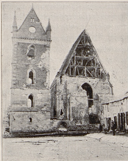
Fig. 3. Kollegiata w Wiślicy.

Przykrzejsze jeszcze wrażenie czynią na nas nowo powstałe budynki kościelne, wytwory międzynarodowej tandety, wypełnione rzeźbami tyrolskimi czy francuskimi, pomalowane „według wzorów sztuki wiedeńskiej“, na co lud polski składa swój ofiarny grosz, wzbogacając w ten spo-