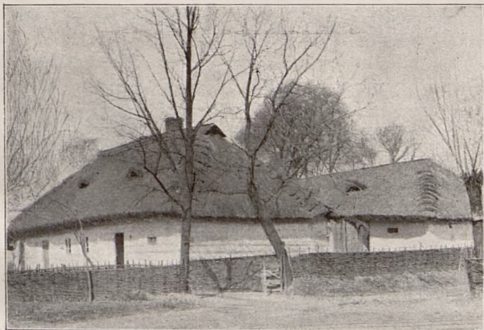
Fig. 10. Chata wiejska w Mogile.

czynów dokazali nieraz ci, którzy pozostając w czasie inwazy rosyjskiej na swych stanowiskach, bronili przed zniszczeniem i rabunkiem nasze zabytki. Objawy to bardzo pocieszające, choć nie powszechne. W wielu wypadkach wojna przybiła umysły i skurczyła serca, to też apa-