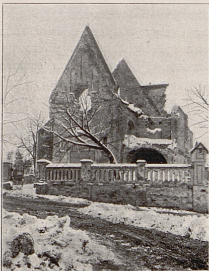
Fig. 4. Kościół w Radłowie.

i pługiem. Musiał orać! To też z tego potwornego chaosu, który wszystko zdruzgoce, on jeden wyjdzie cało, wzmocniony i zasobniejszy“. Zasobniejszy w siły duchowe, nie w majątek.