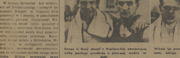
Kampa (lewej stronie) z Waszowskiemu umożliwiającą wielką poślizgię gwardystę w pierwszaj amocjonalnej