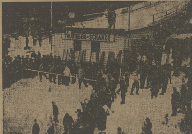
W Niemieckiej Republice Demokratycznej powstaje nowy mowony sport, oparty na wzorach socjalistycznego sportu ZSRR. Narciarstwo zyskuje coraz więcej zwolenników wśród świata pracy.

Forma naszej drużyny narodziła wyraźnie zwycięże. Grymy coraz lepiej. Swawolność jeszcze tylko technika podać, oraz zbyt długie przetrzymywanie krążka — nagłunna wada przeważająca większość naszych hokeistów.