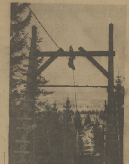
Na akademickich mistrzostwach świata w Poiana Stalin (Rumania) narciarze będą mieli do dyspozycji nowoczesny wyjazd.

Od wtorku śnieg w Zakopanem przestał padać. Jest pochmurno ale temperatura utrzymuje się nieco poniżej zera.