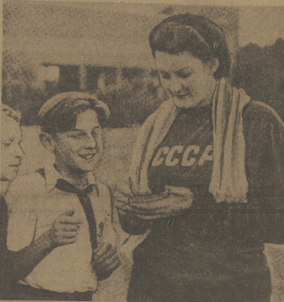
Najtwardsza lekkoatletka, rekordzistka świata w rzucie dyskiem daje swój autograf młodemu entuzjastowi w Prezas podczas meczu ZSR — CSR