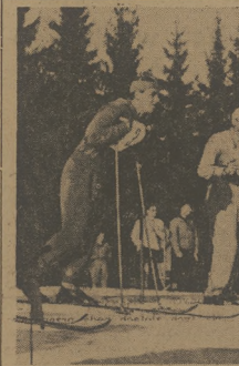
Na stercie sztafety 4 x 10 km w Zimowych Mistrzostwach Zrzeszeń