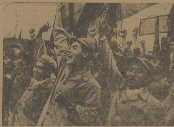
Młodzież 475 milionów!