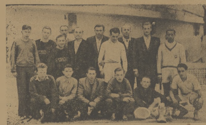
Grupa tenisistów na trybunach w AWF na Bielanach.

z orkiestr, które przyszyły zwykle w ówczesnej Do linie Szwajcarskiej albo na ulicy Składowy, Niekiety tyko z góry, z dalszych otwartych na czubkach okien, małego saloniku dochoodziły dźwięki granych dla nas walców Straussa. Tańczyliśmy w ich takt za pomocą krótkich „ho lendrow” w przód i w tył, uno sząc się przy tym jak natywcy na czubkach łyżew przy końcu każdego taktu. „Po powrocie do miasta melody nie waby nas po tamtych łakowych przestworzach. I tak ślizgawka poszła w zapomnienie. „Koni także zaczął się od „dzianowca” Podwózkow, z ogólnego siwka, na którego rozległy grzebiel wżasnno mienie jeszcze w feudalnej, zresztą dzierżawianej, Lubieńczy, aż do ostatniego konia mego życia Pomidora, w „domu nad lakami” — nie miałam żadnej sposobności wszelkich jazd. W Tworcowie (także dzierżawia) pozwolam kucykami, w Wólinie — dziś przeobrażonym w miasteczko — wywalczyłem wódrabiznasty z całym towaryzstwem, zamierzając podwózkow do lasu. W Tworcowie chciałem chodzić na pastwiska i wdrapywać się na pasące konie, by na oklep wracać z nimi do stajni, zdłżniana na wszelkie ich protesty i nieuprzejmości, obserwując mi, że razy spadłam z konia, bo to do rzeczy nie należy. Zwłaszcza, że wyszło mi tylko na zdrowie.