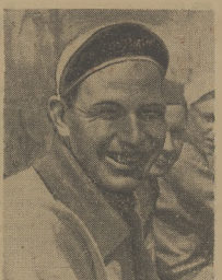
NIEMI Fin. Tul