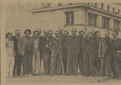
Trenerzy gimnastyki, którzy w ub. sobotę i niedzieli obradowali w stolicy na pierwszym w historii tego sportu zjeździe.

Z zawodników polskiej Borucz nie był specjalnie zatrudniony. Trzeba jed-