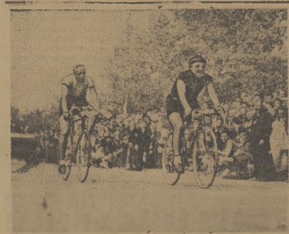
Wzrostki przed Kłopotem pierwsi na mecie wyścigu kolarskiego Gwardii żargonizowanego w Warszawie z udziałem kolarzy zagranicznych. (Sprawozdanie na str. 31)