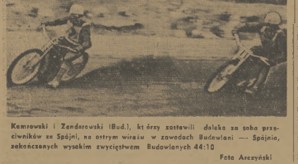
Kemowski i Zenderowski (Bud.), którzy zostawili daleko za sobą przeciwników ze Spójni, na otrzym zwycięstw w zawodach Budowlani — Spójnia, zakończonych wysokim zwycięstwem Budowlanych 44:10.