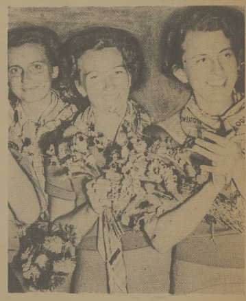
Braterskie przyjęcie na dworcu w Berlinie dało naszym współbraciom nową okazję do serdecznego uśmiechnięcia i dobrych humorów.