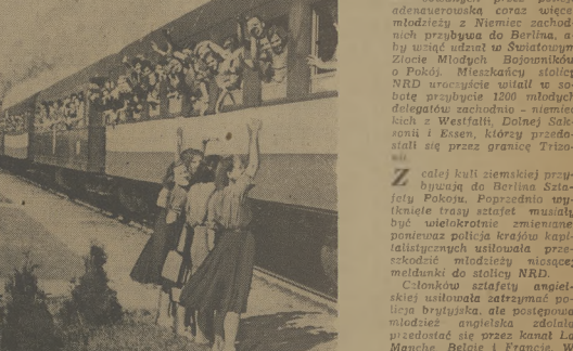
Na Dworcu Głównym w Warszawie, młodzież warszawska serdecznie żegnała naszych sportowców, odjeżdżających na XI Akademickie Mistrzostwa Świata...

W tym dniu na stadionie znajdują się przedstawiciele 90 narodów. Nad centralną lożą powiesiono 82 sztandary. Nadstę do stadionu nie ma nic wspólnego z oficjalną pompą. Jest po prostu radość i brawa!