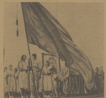
Wielki, czerwony sztandar radziecki poprzedza entuzjastycznie wziętą delegację Komsołowa, organizację przygotowującą w walce o pokój i postęp mi dżyczy całego świata.

Niech XI Igrzyska Akademickie służą dziełu wzmacnienia ruchu o obronę pokoju!