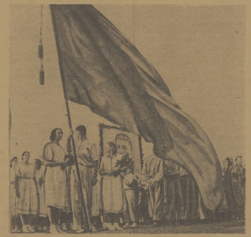
Wielki, czerwony sztandar radziecki poprzedza entuzjastycznie wziętą delegację Komsoolu, organizację pracobójczą w walce o pokój i postęp mi dżyczy całego świata.

ZWYCZESTO MIESIALA Musiał wyraźnie wygrać z reprezentantem NRD Franzem, różnica co najmniej 3 punktów. Franke z zawodnik ofensywny idący bez przerwy do przodu. Polak znakomicie wykorzystował jego nie dość skuteczne gardło i nastawiwszy się tylko na defensywny (Dalszy ciąg na str. 4)