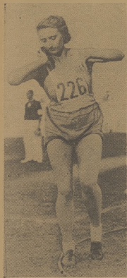
Bregulanka — 12,60 m w kuli.