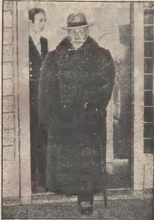
Jak już donieśliśmy zachorował ciężko ekscesarz niemiecki Wilhelm, zamieszkujący w Doorn (Holandia), którego podobiznę wyżej podajemy.