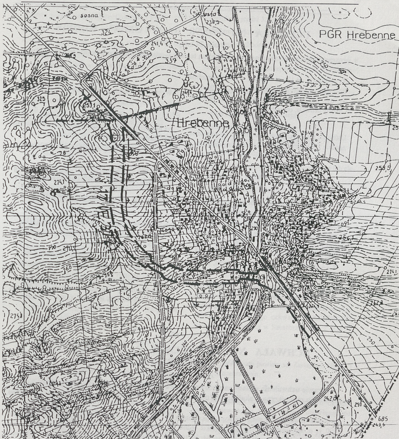
Załącznik nr 1