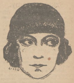
Asta Nielsen jedną z gwiazd filmowych.