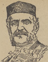
Nikola król Czarnogóry.