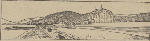
Na prawo pałac następcy czarnogórskiego tronu kr. Danily.