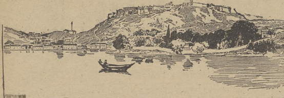
Miasto Skutari, które dzięki zdradzie komendanta Essada-paszy zajęli Czarnogórcy. Miasto to przedstawia wiele wielkich mocarstw uchwalili wezwać do Albanii. Wkrótce polecono mocarstw król Nikita zajął Skutari i ogłosił stolicą. Austriacy oraz Włochy zamierzają Nikitę ze Skutari wyrzucić i miasto włączyć do Albanii lub... zająć ją dla Austrii... wraz z północną Albaniją, Południową część Albanii zająłby Włochy...

br. Mycielski, pos. chrzanowski 89.595 K. ks. Lubomirski, pos. myślenicki 197.440 K.