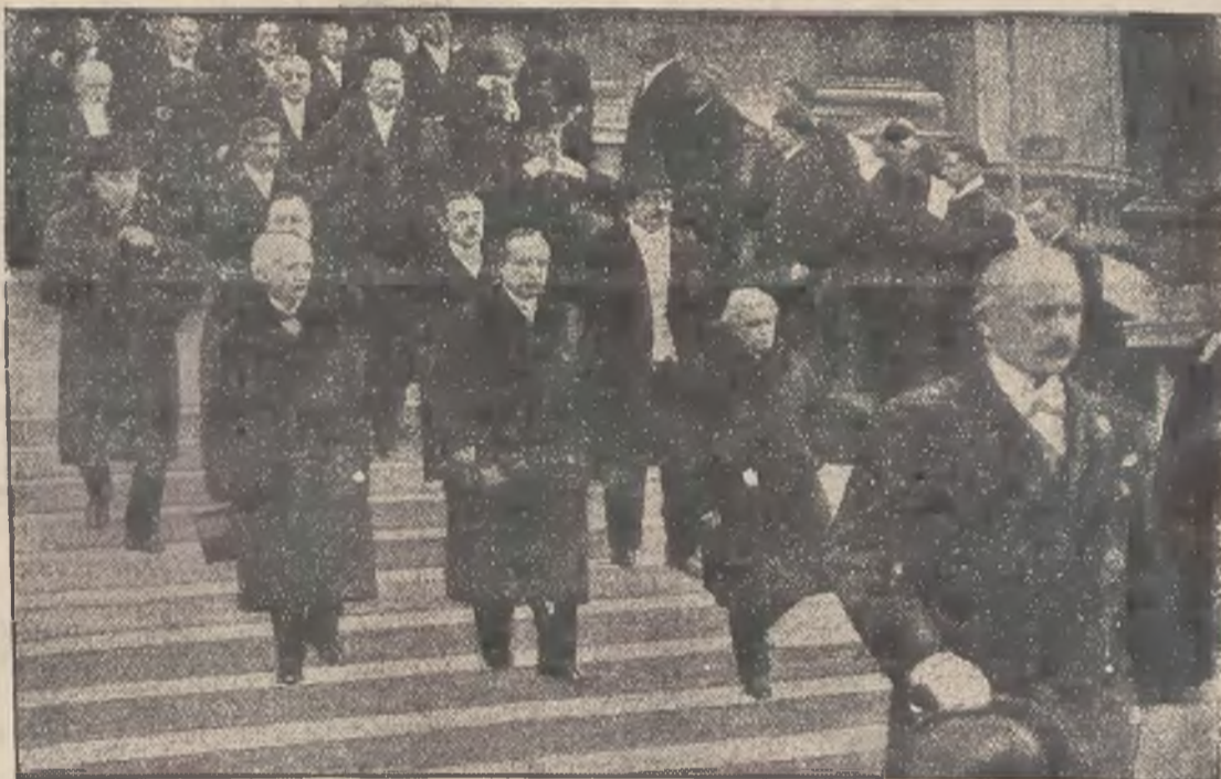
Na zdjęciu widzimy wybitnych mężów stanu, kroczących w orszaku żałobnym. M. in. widać (od lewej) Hymansa, przewodniczącego Zgromadzenia Ligi Narodów, prezydenta ministrów Tardieu i Pawła Boncour.