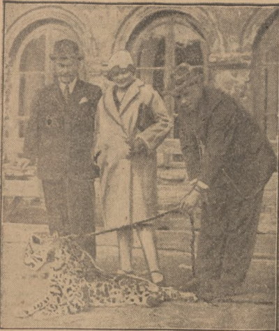
Pn. Geblouie Tarnawa, o których pisałimy wczoraj, przywoził z Afryki kilka bardzo ciekawych okazów zwierząt dla Warszawskiego Ogrodu Zoologicznego. Wspaniały lampart jest tak oswojony, że chodzi na smyczy jak psiaak.