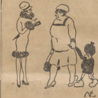
Pierwsza pani: — Wczoraj uwidzia, leń męża pani na ulicy, ale on mnie nie widział.

Istotnie po paru dniach starzec nie dawał znaku życia. Le-