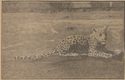
Jeden z najniebezpieczniejszych drapieżników, pantera, również wzbogaci zbiory ogrodu zoologicznego.