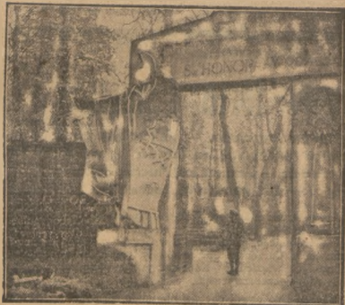
Cmentarz powązkowski i w tym roku jak rok rocznie zapelnił się w święto umarłych.