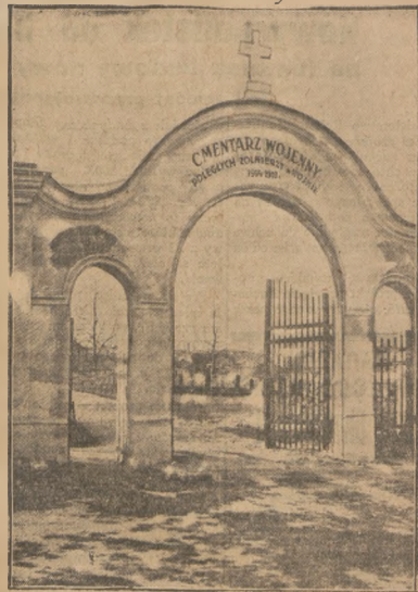
Brama cmentarza wojskowego, na którym leżą prochy naszych bohaterów.