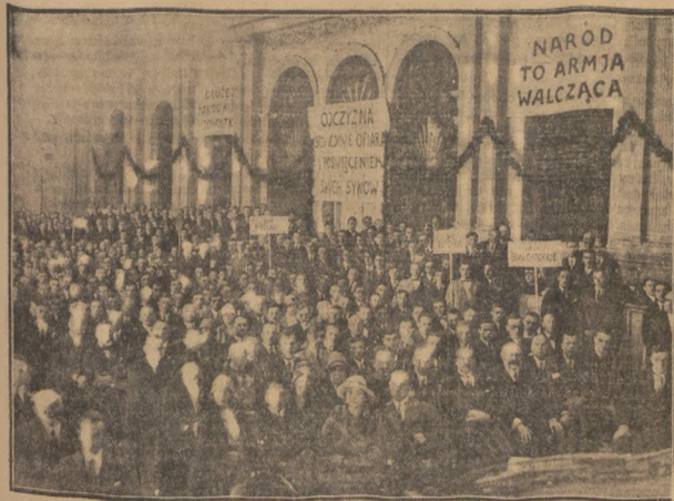
Zjazd młodych dn. 30 z. m. w Warszawie zgromadził zgór 2000 uczestników.