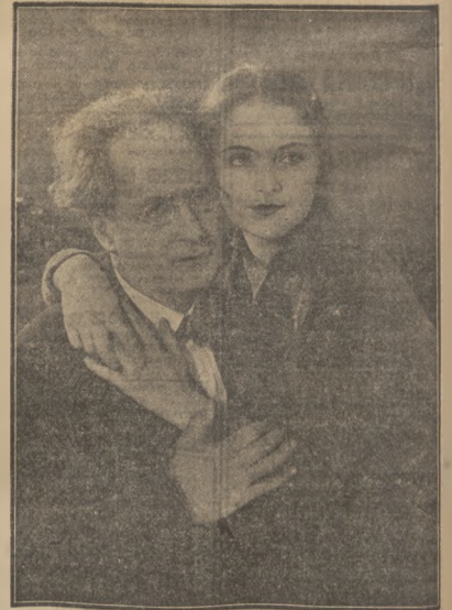
Jedną z najmłodszych obecnie w Wiedniu gwiazd filmowych odwarza czołową rolę w filmie „Młotek”, zrealizowanym podług powieści Schnitzlera.

CENA OGŁOSZEŃ: 1 mm. na 1 szp. (tam pięcioszpaltowy) w tekście 50 gr., — komunikaty — 75., pierwsza i ostatnia strona i zł. zwyczajne (tam 10-szpalt.) — 15 gr., drobne i słowo 10 gr. tabelaryczne o 50 proc. zastrzeżone miejsca 25 proc. drożej. Ogłoszenia przyjęte do N-ra niedzielnego liczą się o 25 proc. drożej.