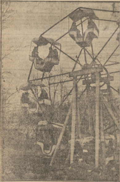
Hucznie i niesło jest w „Lobzowiance” tym Luna Parku Akademickim. Wszyscy się tam bawią, starzy czy młodzi, popierając w ten sposób VI Tydzień Akademika.