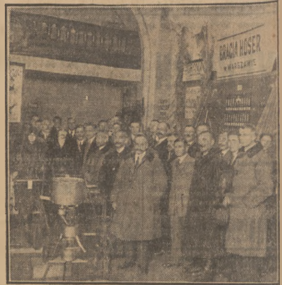
W dniu wczorajszym w gmachu Centralnego Towarzystwa Rolniczego w Warszawie została otwarta wystawa nasienna. Wystawa potrwa kilka dni, wejście na nią bezpłatne.