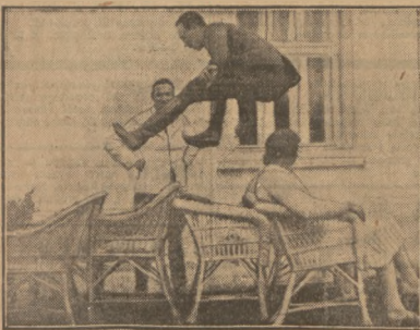
Oto do jakiej pracy można dojść, trenując się stale.