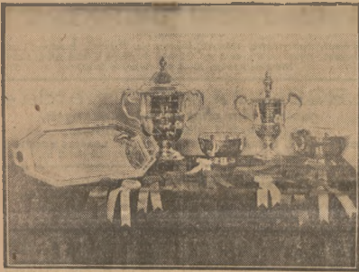
Ogólny widok nagród zdobytych przez polskich jeźdźców płk. Rómmla, rtm. Antoniewicza i por. Starnawskiego na międzynarodowych zawodach w Ameryce.