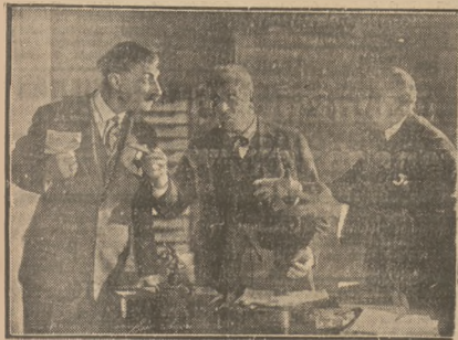
Jedna ze scen aktu II tej doskonałej komedji, świetnie granej przez cały zespół.

W dzisiejszym numerze, rebus zamieszczamy na stronie 9-tej