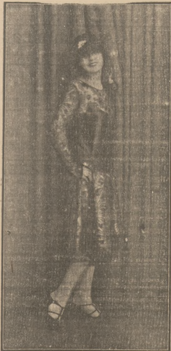
Nader oryginalna i pomysłowa kreacja wiosnowa z czarnej koronki na różowym crepe saten, staniczek czarnej, wykonana w mgazynie mód „Ars - Femina” (Ossolińskich 1).