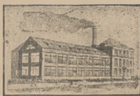
Ogólny widok nowej fabryki.

wabniczej) w Śleicach za Belwe-rem i wyposażono ją w najnowsze maszyny i urządzenia. Fabryka zatrudnia 150 pracowników i jest największą tego rodzaju w Polsce.