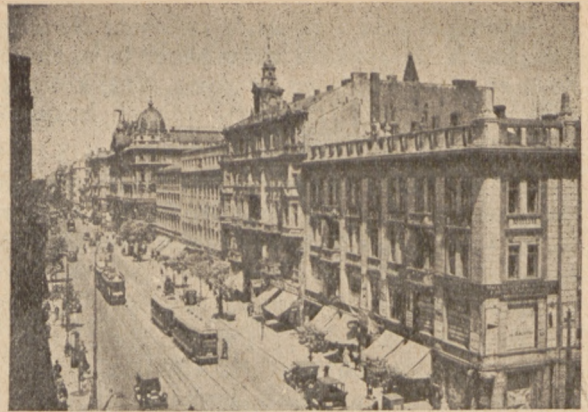
Varsovio. Str. Marszałkowska

Kaj mi mem vidis ĉe la rusa — hungara fronto en la Karpatoj, kiel ideorespekto ĉesigis militan sovaĝecon. Estis tago de Kristnasko. Neatendite aperis blanka flageto ĉe la rusa tranĉejo. Ni pensis pri kapitulaco. Ne estis tiel. La rusaj soldatoj, portantaj modestan regalajon en la mezon de la intertranĉea tereno, deklaris, ke ili proponas kvarhoran armisticon al la malamiko, ke ĝi