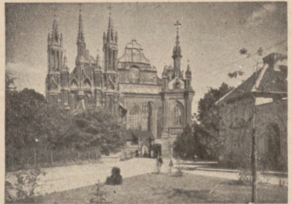
Wilno. Preĝejo de S-ta Anna.

Dum la Kongreso okazos diverstemaj prelegoj interplektitaj en la programo. Inter aliaj parolos: