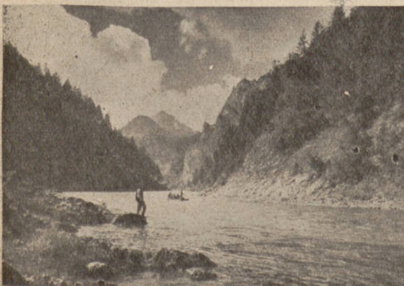
Pieniny. La rivero „Dunajec“.

Laŭ la lasta jarraporto K. E. L. I. estas reprezentata en 18 landoj. Oni kalkulis entute 460 anojn. Plej forta estas la movado en Nederlando. En lasta tempo ĝi treege kreskas en Svedujo. Nova vivo montriĝas en Francujo kaj en Japanujo. Anglujo jam de la komenco tre bone kunlaboris. En Germanujo dum la nunaj cirkonstancoj anoj ne povas esti kalkulataj. Tamen ĉiuj restis fidelaj al la movado, kuraĝigas eksterlandajn geamikojn per daŭra korespondado kaj per monsubtenoj por la laboro de la ligo.