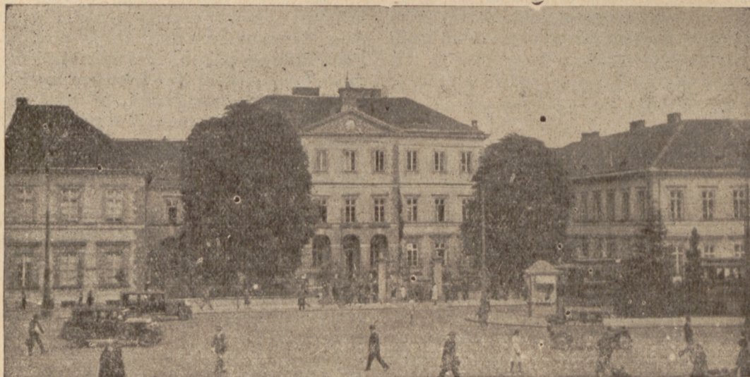
Stata Blindul-Instituto en Varsovio, kie okazos la XIV Kongreso de Blindaj Esperantistoj