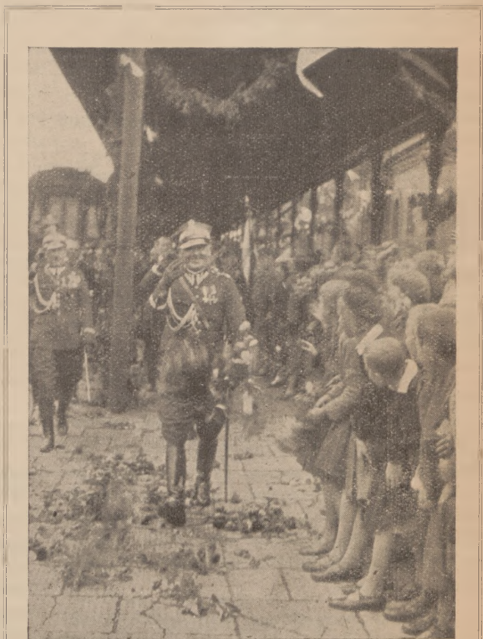
(Zdjęcie ze stacji kol. Skierniewice)