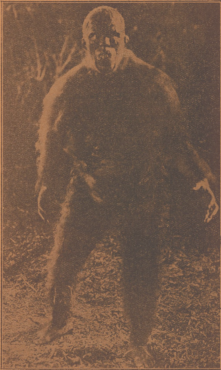
Małpolud ze „Świata Zaginionego”

Rok czasu — rok wysiłków — rok zmagania. Nie doliczymy wśród redakcyjnego zespołu wszystkich, których wi-