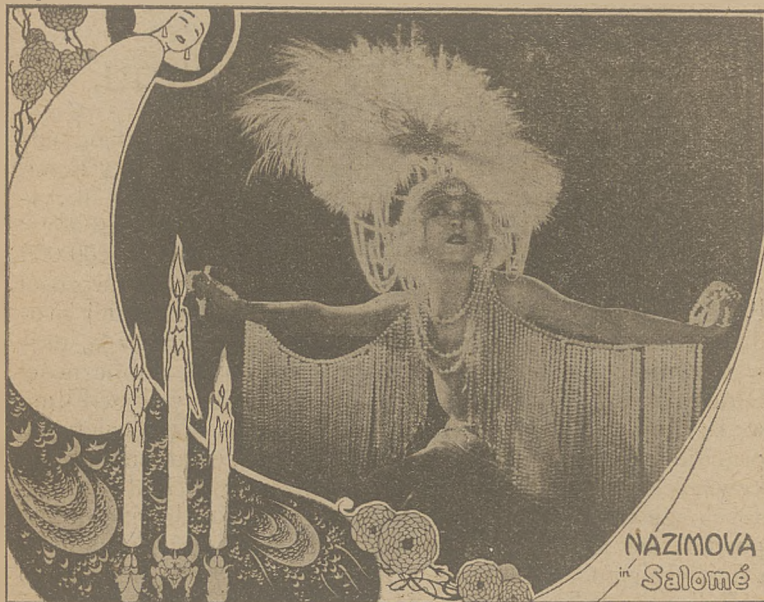
Nazimowa w filmie „Ślub miłości i śmierci” (Salome)

— Scenariusz do filmu „Podróż do Tylzytu” według powieści Sudermana opracowany został przez Karola Meyera. Będzie to pierwszy film F. W. Murnaua dla Fox-Filmu. Zdjęcia rozpoczęto.