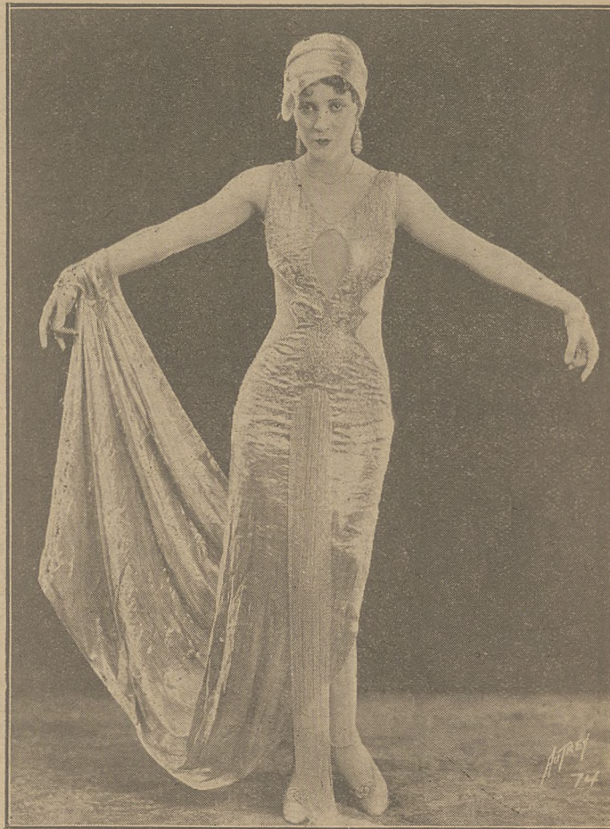
Olive Borden, słynna piękność amerykańska, nowa gwiazda wytwórni Fox Film.

Motyw poetycki może wynikać z poezji tła i stąd właśnie rodzi się pojęcie poezji zdjęć. Dobrze uchwycony zachód słońca (niebo usiane błyszczącymi, zda się z rozpalonej lawy, obłoczkami z śladami zamierającego słońca) nad bramą tryumfalną w Paryżu (Paryż — wytw. Aubert),