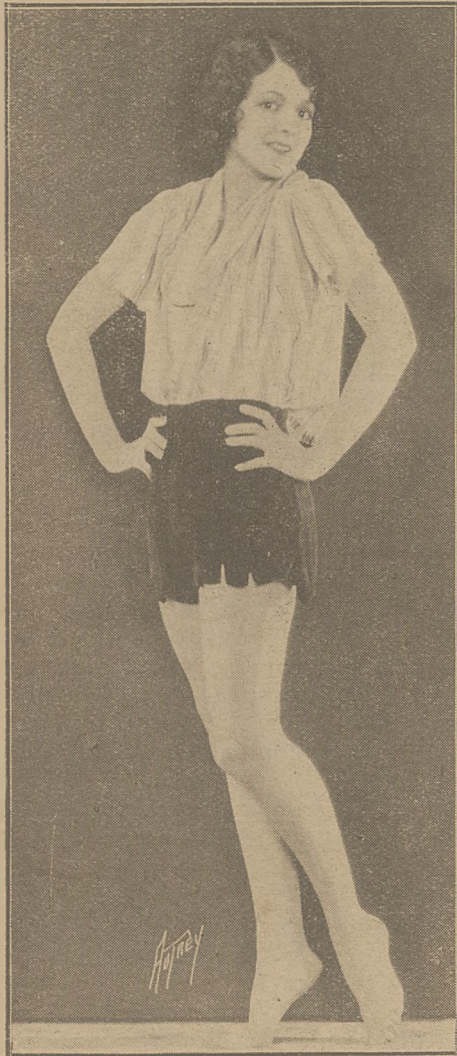
Janet Gaynor, zwana „Janią z Hollywood“, nowa gwiazda wytwórni Fox Film.

Dość dużo głosów słyszeliśmy już, przemawiających w imieniu kina. Były to głosy oględnej krytyki, lub daleko posuniętego teoretyzowania istoty kina. Rzadziej ktoś zachwycał się w barwnych słowach czarowną taśmą. Nie odmawiano racji bytu kinu, przeciwnie rokowano najmłodszej z muz świetlaną przyszłość, lecz z tego, co obecnie