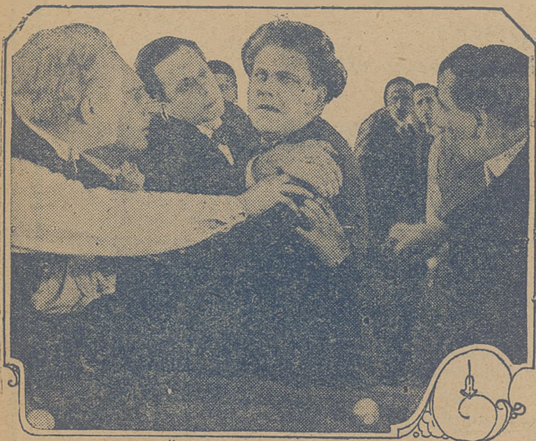
„PERJURY“ ~ WILLIAM FOX PRODUCTION.