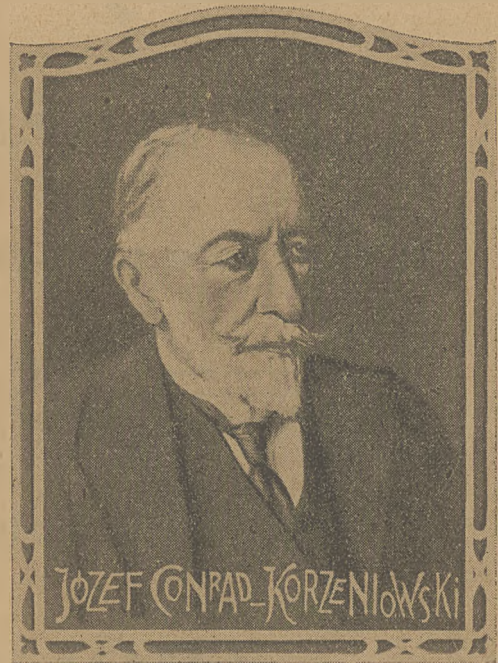
Autor powieści „Nostramo“, która została sfilmowana przez wytwórnię Fox Film.

160 metrów nieużytku wypada na każdy metr wykończonej do wyświetlenia taśmy. W latach trzech, podczas których trwała realizacja obrazu przesunęło się przez aparat 14.000.000 pojedynczych scen. 160 000 metrów materiałów zostało zakupionych w Berlinie na 8.000 kostjumów, płaszczy, rekwizytów, e.t.c. 22.000 kilo miedzi i blachy użyto na: 6.000 kompletów zbroi rzymskich 9 000 funtów skóry wyrobiono na obuwie i rzemienne przybory. 8 000 kostjumów. podług ściśle historycznych wzorów. 100 starożytnych statków wojennych, zbudowano do scen bitew morskich. 48 aparatów kręciło równocześnie odnośne sceny. Cyrk zbudowany specjalnie, mierzył: 500 metrów długości i 50 „ „ wysokości. 100.000 widzów mieściło się wewnątrz cyrku podczas wyścigów kwadrygami. 42 operatorów robiło przy tem zdjęcia. 20.000 metrów negatywu użyto na te sceny. 12 woźniców oraz 12 różnych narodowości. powoziło 48-ma ognistymi rumakami, zaś rekord wyścigowy osiągnął w kłusie 37 2/5 sekundy na 1 1/3 angielską milę.