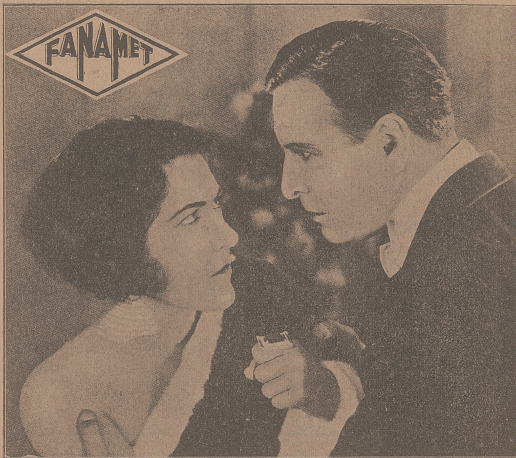
AILEEN PRINGLE i CONVAY TEARLE W „KSIĘŻNICZCE CYGAŃSKIEJ“