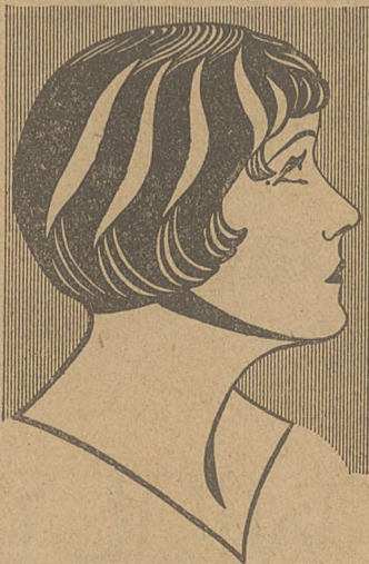
Tryumfatorka sezonu w Polsce „FANAMET“