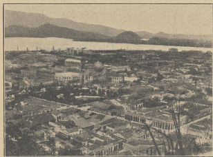
Na ziemi konkwistadorów.

A barwy? — Pod tym względem jesteś człowiekiem, którego neka brak daltonizmu. Fascynuje cię każ-