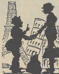
Pat i Patac w bawia publiczność w kinie „Nowy”, jako cyrkowcy.

*) Przy tej sposobności prostujemy niedokładność, która się zkradła do biografii, zamieszczonej w nrze 10-ym „Nowości Filmowych”, wskutek nieściślych danych. Musimy na swe usprawiedliwienie dodać, że szerokości biograficzne prawie wszystkich gwiazd filmowych są często tak sprzeczne, że trudno utrzyć się pewnych niedokładności. Tylko wyjątkowo ściśle źródła, jak powyższy wywiad, o które zawsze się staramy, będą mogły te „legende biograficzne” korygować. (Redakcja).