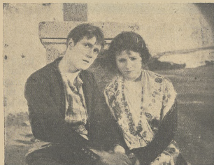
Scena z filmu „Galeria okropności”.