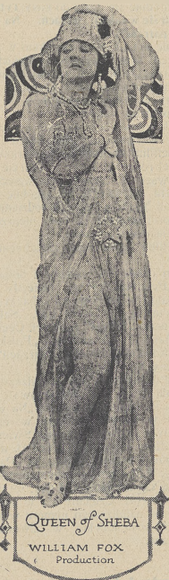
Betty Blythe, w słynnym obrazie Fox Filmu p. t. „Królowa Sabba”.

czyli jego bratanek, który usuwa stryja do szpitala obłąkanych. Po długich perypetjach uczony profesor znów staje się człowiekiem i odbiera uczciwie zasłużoną nagrodę za dokumentalnie stwierdzoną teorię Darwina.