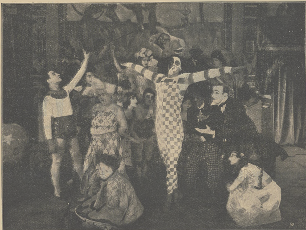
Scena z filmu „Galeria okropności”. (Wł. „Seux - Westi”).

Two oczy cudne, takie dla mnie drogie, Nigdy nie spoczna na mej smutnej twarzy,