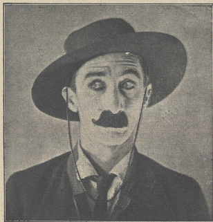
Clyde Cook (Dodo), jeden ze słynnych komików „Fox Film Corp.” powiada: „Ludzie mówią, że różnica pomiędzy człowiekiem a zwierzęciem jest ta, że człowiek śmieje się — ja nigdy się nie śmieję”.