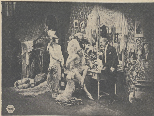
Scena z filmu „Paryska zabawka” („Le joujou de Paris”) z udziałem Lilii Damity w głównej roli, sławnej primabaleriny Opery paryskiej.

Nazwiska osób bezpośrednio odpowiedzialnych za wprowadzenie w błąd władzy wojskowej — są znane, nie wytoczono jednak dotychczas żadnego procesu sądowego.