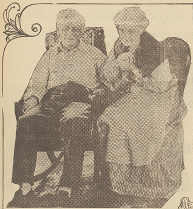
'OVER THE HILL' ~ WILLIAM FOX PRODUCTION

Scena z głośnego filmu Foxa „Czwarte przykazanie” (Matka). (Over the hill), który święci obecnie triumfy w Paryżu i będzie wkrótce największą sensacją Warszawy. Film ten poświęcony jest „synom i córkom całego świata”.