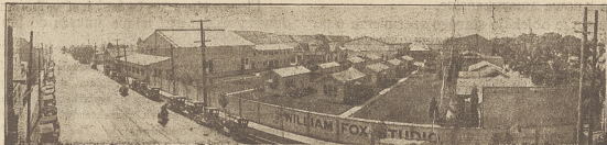
Rzut oka na wytwórnię Foxa w Filadelfii.

W roku 1914 pierwszy raz ukazałem się na ekranie w „Oichtani” i w „Ciemnej Purpurze”, a następnie, z Głorją Swanson w „Wielkiej Chwili”. Występowałem potem bardzo często, między innymi w „Wyspie Zaginionych Okrętów” i „Płynącym Złocie”, aż wreszcie w „Demonie Morza”. Była to rola jakby dla mnie stworzona. Zapomniałem kim jestem, zdawało mi się, że zostałem przeobrażony i że naprawdę jestem Sakr — el — Bahrem, Demonem Morza. Zapomniałem, że to tylko rola, i żyłem cały jego przygodami.