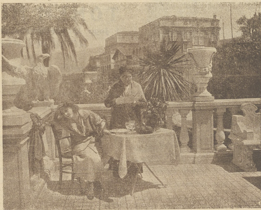
Scena z bogatego filmu „Bachantka” własność Tow. Fox Film, Warszawa.

W przyszłym tygodniu, sławna Dorota Macka 11 , przyrzekała mi opowiedzieć, jak zdobyła swoje powodzenie.