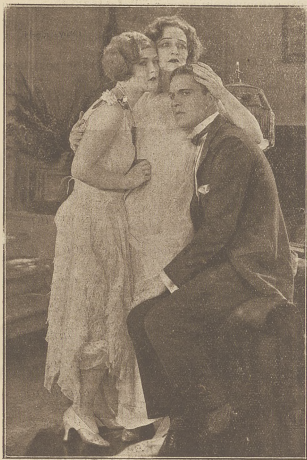
Paulina Frederick, Laura La Plante i Malcolm Mr. Gregor w filmie „Universal Pictures Corporation“, p. t. „Smoldering Fires“, który ukazuje się wkrótce na ekranie kina „Apollo“.