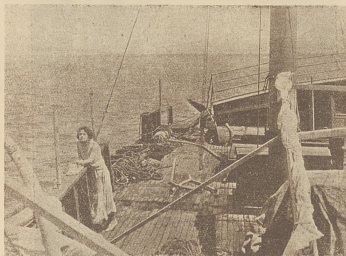
Scena ze wspaniałego filmu „Piękna noc” (Własność: „First National Pictures”).

Ważnem jest również i to, że wielkie przedsiębiorstwa amerykańskie, jak „First National Pictures”, „United Art”, „Paramount”, „Lew - Metro - Goldwyn” etc. wogóle nie posiadają masowej produkcji.