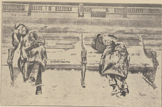
ראם עלקער און לנדאן: אייביסלפולע מערדערענען, די קאלטע ווינטערנאכט אויף הארטע בעקט און א נשרטען.

מערדערענענען א מירדארמירלע, די 4 פערברענע האבען אויך חובב בעקסען זייער סבך, עס זענען דאס נעמען נאר געפערלעכע מערדער און דאס נאמען סאלק בענינס זייער מירדעס בעקערענענע. דאמט אוי אבער די מאלטישע וויס פון דעך פראגע נישט געלעט. בי מירדענענענע פערברענע וועט דעך ס'עירענע וויסער די ארומיגע נישט וועלען בעשטענענען.