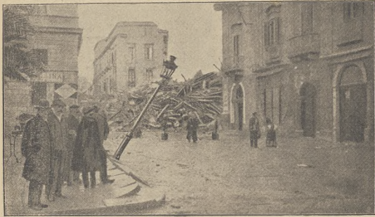
נאך דער קאמאטראפע אין איטאליען; די ווערזענען און סענאט.

דער קעניג און די קעניגע פון איטאליען איז צווישן אונטערשולדיך די פערטאליטעס צו העלפען, און קעניג ליכען שטראנאלע נוען די ווארפאטען קלוידער פאר די אונטערליכע און די קעניגען מיט ווי דאס קעניגשאפט איז און נאנצען לאנד נעווארען שטארק פארלירען.