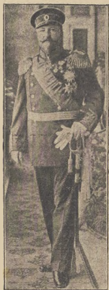
שריקע און בווארען: קענט פערזענליך

א צווייט לאנג איז די לאנגע נעווען וער ענטעס עטערנישען-רע