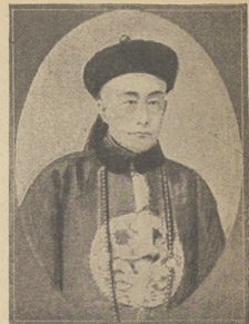
הויפט מארישעס און מינא: דער מיניסטער וואוינדיק, וועלכען טראגן שוין האט אפגענומען פון זיין שטעלע.

אין נעקענזאמל פון די נאמארען דעם סטערעל צוריקגע- טראגען און מוקאום איין און פערטעסטימט א פראמא- קאל. אין וועלכען עס ווערד ערשטעשטימט. או דאס איז פאקן דער אייגענעליע סטערעל אין מען האט אים חת- וולילה נישט פערביטען. דאס קאנצערט איז אפגעלאפן נלעגענדי. הונדערטאן דאס בערליקען וואס ער עקל. אין אונזער הענטשעך נעמער בערענען מיר א איינ- נעל בילד. וועלכעס שטעלט פאר בראטיסלאווי הענערמאן שפערלעכער און פאנאניעס סטערעל.