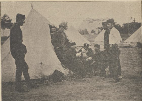
ביי דער סערבישער גרעניץ.