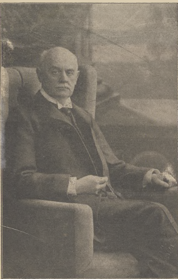
אויסלויך ווישען עטערניש און דער שריקע: שריקע און קאנסערוואטיוו, דער עטערנישע אונטערשטייג און קאנסערוואטיוו.