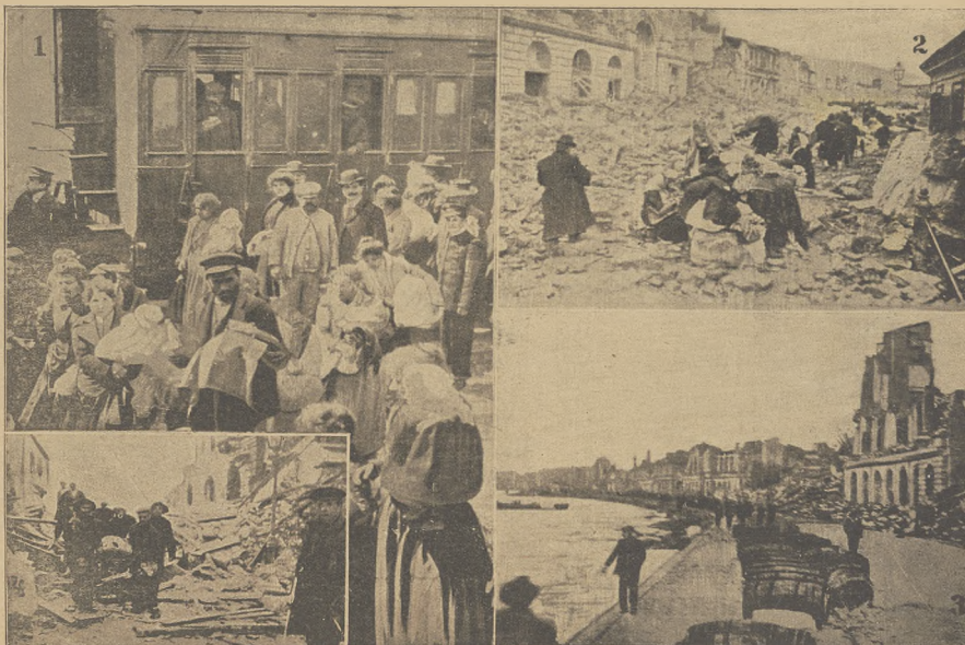
נאך דער קאטאסטראפס אין איטאליען: 1. די מערונגלוקסע עווארשען א הילסענ. 2. א צערישטערע שטאט אין מעסינא 3. די צערישטערע בנקס און מיטגלידן אין סעניא. 4. די מאסראָנן שרינען לעוואוירענע אַויס א צערישטערע הויז.

איטאליען; נאך דער קאטאסטראפס אין איטאליען. — אויסגלייך צווישען עסטרייך און טירקיי. — קריגע אדער פרייערען. — בולגאריען און טירקיי. — ארמאנאל ראשדעסטענעסקי. — בעריובט אין דער קירבע. — דינאמיט-עקספלאזיע אין א קאסטענע. — בראניסלאוו הוכערמאן און פאנאי גנים פיערעל. — בענארוווגענעד נאכריכטען און בינא. — דער ביראסקרבן. — האבצייט אין דער קאנעוירלעס פאמיליע. או. ה. או. ה. או. ה.