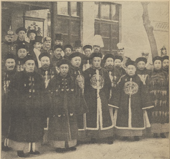
הויפט מארישעס און מינא: פונען שוין כולם זינען הויפטענע אויף א בערד ביי די יודישען סאמארא.

פאנע וואך האבען די מאראנע דאנער געשענע זינער נעקסטען איינשט- דאס ביראמסיקע. לויט אנאלאגיק אבער לענענענע שטאמט דער יוסיפוב פון די עלטסטע צענען אלס אנדערען און אבידים אביד. וועלכער האט אין דער צוים געוואלט זיין וואן זשעמאל נישט יצחק זון פון די יודען פארב זיין פאר א קרבן. די מאראמסיקע בערלישען אויך. או די קרדן האט געוואלט נעשען. זי און מקרא. אויף דעם ארם. וואו זינער נבוא מארהאנדעל לעבנס בערלישען און אמפערעס און עסקא הילונשין פון אבראם צווישען. אלס אנדערען און דער עקדרא. ישמעאל. אויף ווערד מארהאנדענע. וואס בערענע א געוויסען נאר פערמקען. משה פארב צו זיין א קרבן. דאס הענט צו קולען א שפעציעל וועלכעס ווערד צער- מהילט אויף דיי מהילט און מהילט פאר איינע. און מהילט פאר מהילט און דער רושער מהילט ווערד געגעבען פון דער פארמילע. דאס קרבן פון זיין געזין און א מים. דעיערשט מען נאך דעם קויפן. או עס האט א פארלעך בערליע עס נא- ארטימטע מארהאנדענע געגעבען פאר א קרבן; א איינער פון קויפן און אנדערען. אויף אים פארמילט מוים מולאנען ווערד געקויפן און קרבן ווערד דעם ערשטען הילפסאמטען און נעקענזאמל פון אלע האבענעכען. אונזער הענטען אילובטריערע שטעלט פאר דאס בילד. זיין עס ווערד אים פארמילט פארמילט דער קרבן געוואסן געקויפט.