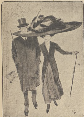
א קלוג פארשולדיגט נובס ווי ס'זענען.