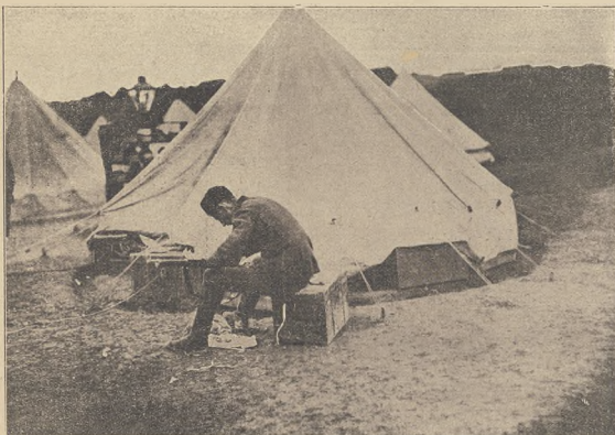
ביי דער סערבישער גרעניץ.