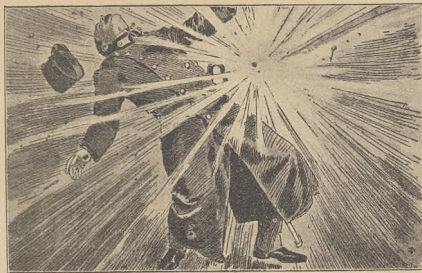
מאכענדיקע קעסלעך און א קאמפניע: ליכטאנט שוידער טרעטע זיך אין דער שטעטלעך קאמפניע דורך א דראמאטיש-מאראנע.