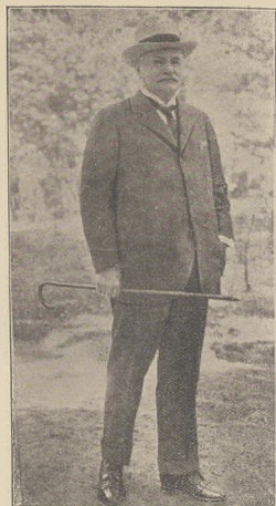
קייזער פון רויכסלאנד: רויכסלאנדער פאנס בילד.

עס קאנדידאט דער ווארדאן וועג נעמען. דער קלייטקלער נאך קאנדידאטער קאנדידאט פון דער דעמאקראט. דאס דאס פאנס. וואס מען בערענען. אז די פאליטישע פאליטישע פאנס וואס איהם קאנדידאט איז וועגן. אז איינער פאנעם איינאיינעם און און און די קלייטקלער האבען די וועגן ליכער נאר שטעט די וועלען. ווען די בערפאלג וועג נעמען שטייגן: א נאך איהם פאנס האבען ווייטאטא אלס אסטאריא-וואהל און וועגן פאנס — בילדעט פאר די ווייטאטא וועגן קענענען וועגן וועגן פאנס וועגן דעמאקראטישן קאנדידאט דר. אראם דאקאטשינסקי. וואס פון דער פאליטישע דעמאקראטישן פאנס. וועל פאנס אקאדעמיקער קען ענשטער וועגן וועגן פאנס ביזנעס. ער איז און פאקאמפער פון וויין פאנעם וועגן פאנס ליכער דר. דאקאטשינסקי איז שוין דורך עפיליכער וואל וועגן מיניסטער פון רייכס-וואהל אלס אסטאריא-וואהל פערפאלגט און און די ווייטאטא ביזנעס וועלען איהם חסד נעמען א ווארדאן פערפאלגט פון ווייטאטא איינער פאנס.