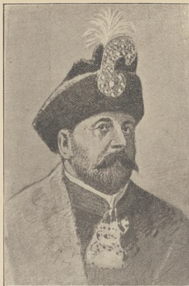
די אונגארישע קייזער: וילהלם פון וויטער, דער פרעזידענט פון רויכסלאנד.

פלאץ פאר א נייעם מיניסטער איז נאר דערמאנט פארהאנען. ווען עס שטארבט א פירער מיניסטער און איבערנעמליכענע מיניסטערס וועלען דעם נאכפאלגער נאכדער וועלען דעם נאכפאלגער און א ביסלע שטייגער ליכטיקט און אזוי האט לשלשל עפיל וואל א נישט געקענט בעקומען דאס קיין פלאץ ווייל אויפגען די עלטערע אקאדעמיקער האבען זיך געפונען מעלע וועג נעמען. אבער דאסען מוז עס איבערדעסן. אז איצט. ביי דער באמערשטערנער וואהל פון נייע מיניסטער. ווער נעמענעט אלס אימינאסטאליע קאנדידאט דער בעזעצער פון א פאריער בראמזווידשענע מישעל פאנס. דער שטענדיק איז און און א פאקאמפער ריכטער און דאס מאסערע און ער איז בעשיטעס איינזענעמען און דער אקאדעמיק דעם ווי פאנס אינעם פערשטארבענעם ריכטער פאנסא קאפער.