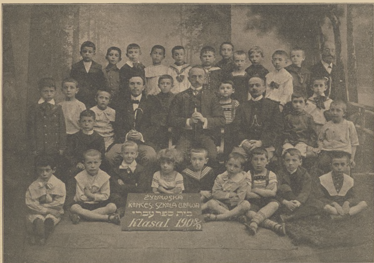
זידע-עברי און קראקא: די שולע אין די לערער פון דער ערשטער קלאס.

דאס מראשע פון א פראגאנער יודישע און קולומביער ערציעהען פון דער יוגענד בערעכענעט וועט א צום נאגן שטארק דעמען יודישע עלטער, וואס וועלכע דער קינדער ערציעהען שטייגט יודיש, דאס אבער אויך ווי מען געלעבנדיג וויל אפגעצויגען דער ערשטע טייל פון מראשע יודעס, וואס וועגן הינטע מיט אים פאר יעדען מיטען. און די אלגעמינע שולען ווערען אפער ווער וועגן געלערנט יודיש, דאס ביסל, קליינע, וואס די קינדער