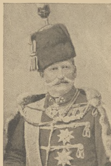
די בלאט בוי באלערקע: גענעראל פערשטער, וועלכע דאס וויל ביי דער בלאט בערערס אויסגעצויגען.

די פראגא האבען מיטגעהאט די פערשטערקע פון קהל, ראבנער, דר. מהר"ם ווי אויך א גרויסע צאל בינער פון אלע קלאסען, און אלע אונגעקערט האבען געוואנדערט די גרויסע פארשידענע וועלכע די קליינע שולע האבען געמאכט און דער קרעדער צייט וואויראל אים געברענגען ווי אויך און אלגעמינע יודעס, דאס לערער-מאטעריאל ווי אויך דער פראגאנער-ספר שטארק פערדינט די געלטע אונגעקערט וועלכע איז אויסגעקוקט נעמאנען אין די קרעס פון ראבנער, דר. מהר"ם און קולומביער-קענט דר. מילער. מיט פערנען און אונזער הינטערשטע נאכער א פאר מאנאטעס אדאמאנטע פון די שולע פונם "בית-ספר-עברי" צוואמען מיט די לערער און ווערען אים דעם וועג, און די יודישע פאלקס-שולע, בית-ספר-עברי וואל וויל אויך ווערען געשווערען ווי ווערען און וואל ערשטע דעם צוועק פאר וועלכע ווי אים געשטעלט.