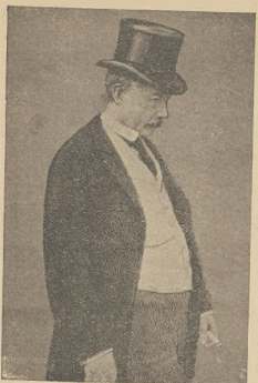
דאָסן דער ראקסעלער.

די פֿירטע און די ראַפֿעציע האָבן אַבער נישט מאכט א לאָס; די רעגירונג האט זיך געזען נישט