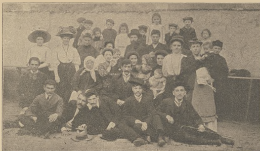
יודישע אויסוואנדערער: א גרוסע פון רוסישע עמיגראנטען אין קראקא.