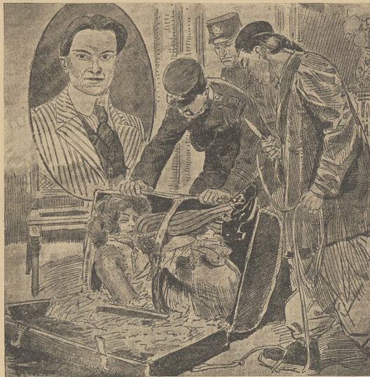
די מרות פון דער מיניסטער פאר און ניו-יארק: די אילוסטראציע פארמאגט די ליבע פון מרל, וועלכע אים קומערט. אויבערן דאס בילד פונם מערער.