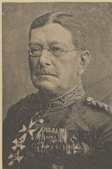
קריג ווערן קריסט: גענעראל נאליק

די מאכער פון דעם נאמאנט-קאנישען מאריד ראט, גענעראל פאליק, וועלכע אל מלוצים פאר שווארצן געווארן אין מען האט נישט געוואוסט וואוירן.