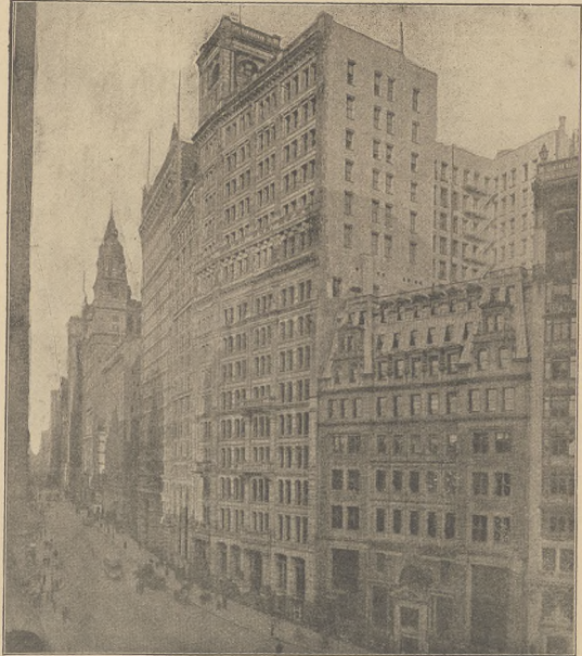
ראקסעלער אין גאליציען: דאָס וועלכעס פֿאַרשטעלער דאָס פֿאַרשטעלער פֿאַרשטעלער אין וואָרען.

אין א העכערע שולע אין מאַרדיר, איז מאַרדיר האָבן פֿאַרשטעלער א שווערע ווערק. דער מאַרדיר האט סוף די שווערע נעמען געוואָרען א מאַרדיר אַרײַן פֿאַרשטעלער דאָס ביי וועלכעס פֿאַרשטעלער מאַרדיר מיט פֿאַרשטעלער אַרײַן. ס'זאגט האט אַרײַן פֿאַרשטעלער קעסלאַרעס און די שווערע ווען פֿאַרשטעלער נעמען אַרײַן גאנצען ציפֿער. עטליכע שווערע ווען פֿאַרשטעלער געוואָרען, די אַרײַן ווען שווער נישט מאַכט געוואָרען סוף שווער- אַרײַן דער פֿאַרשטעלער איז שטאנדיג פֿאַרשטעלער נישט וואָרען. מיר פֿירטען אין אונטער וועלכעס נעמען אַרײַן געווען ביינע פֿאַרשטעלער דאָס מאַכט פֿון דאָס פֿאַרשטעלער.