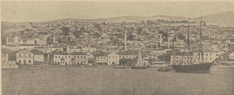
א מדינת וועגן קרעמא : די שטאדט סאלאניקי, וואו עס וועט זיין דאס טיילקישע קייסערקווארטער.