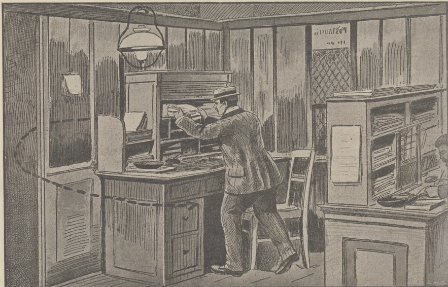
דער גרויסער פאסטאמאטאניקאניא פון 119,000 קאפן אויף דער סטאטיסטיקאניא אין ווען

אינהאלט: די רעוואלוציע אין פרוסען — גענעראל קאליפערט — א יודישער ביזנעסער אין ענגלאנד — דר. אדלערס יובילעאום — א געדענקטאג פאר פרוסען — זעלעוואויטש — ראָסוילד אלס זינגער — פּרעזידענט פאליערס אויסגעצייכענט — דאס נייע קיינסשיף — א פאלישער מאדיר — אויס, דאקטאר אים, מארשאל אה. ה. וו.