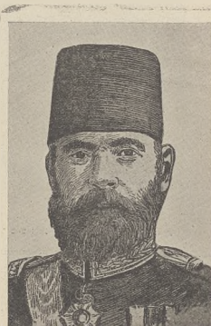
מארשאל דעם פראנצויזישער.