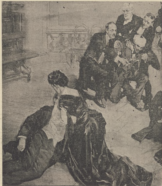
א פארשטיינער-שטאל און א געוועזענער פון דעם אסאכערער-שטאל, וועלכע.

קומען געקן פראנצוס פון דעם געלד, וואס מען וועט ביי ווען פרעקער, דאס נאנצ וועגער סובליקס געווען ליבט זיך אין דער אויסמארשט, דער קומט מיט גיט דערמאל, אז ער האט געזעהן דאס אים פרעמער פערקעמער פארשטיינער, אבער לעזערט ווערן דאס אלעס ליכטער לעזער קאנענאנצער, די מיינעל ווערן פערשוואנדען.