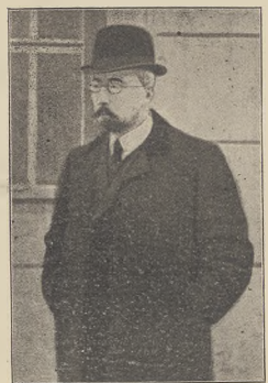
די גיט מיר: דער צווייטער דער געוועזענער פון די דעמסע פארשטיינער-געוועזענער.

דער אסאכערער-שטאל איז אסאכערער, וועלכער איז געווען געשטעלט מיט דער פערקע-אסאכערער, מי וועלכער ס'ווערן געפירט געווען מילע פארשטיינער, געפירט ווי צום א פרעמער, אין געווען אים קאנען-מיר, מיר שטעל רוסט ער דעם געמאכט לעבן מיט צווייטען צווייטער