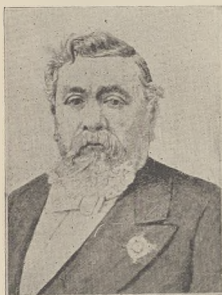
פרייענעם פאליע אומגעצייכענע: דער פראנצויזישער פרייענעם פאליע אומגעצייכענע.

ווען בודער. האקלוב מאשא. איז געווען קאפער-מאשענע פנים סולטאן און ווען פראנצויזישע האט מארשענעם געזען דעם סולט. ראקסאר. און דעם סולט. מארשאל. און און געווען איינער פון די איינפירטאטען מענער אין סולטאן פאלאק. איצט איז געווען ווען סוף. סולטאן מארשאל V האט אויסגעזען א געזונטליכע לויט וועלכען אומשניטע פאשע פערלעכע וועג עסער און וועג סולט. ער ווער געשטענען פון דער ארמעי און געזען און ארמעי נישט מער. מירקס דעם סולט. ראקסאר און דעם געזענעם מיט מירקס. מארשענע. וועג ווען בול פרייענע מיר און היינטיגער נומער. איז מיט א מאל געווען אויס. דאך. מאר און אויס. מארשאל.