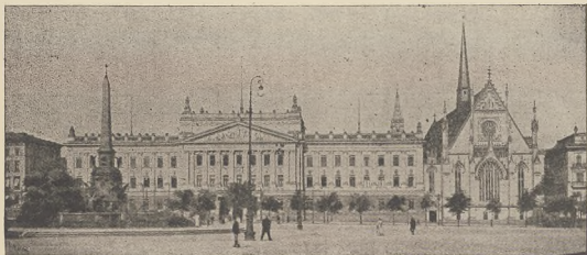
500 יעתינעס וויולקאס פון דער לוינער אונטערשטע: דאס היינטיקע אונטערשטע פערזאנעל.

די נענעמלע פון די שטאטער ביי סעליא און ווער בערדאטע שטעלען נענען די ווי קאמילען דאס אויסנעמס און שטאטען א נויטע אפצווערען, דער אפצווערען פון סעליא, נענעמלע פאר- דעם ווענעמסנעם נאך 76,000 מאן מערשערקען, כדי זו קענען די קאמילען בענימס, אבער דאס שטאטען פאלט ווייל פאר דעם צוועקלאזען קיינעם וועגן נישט נענען אפאל און ווארשען און קיין פוישע, די איינע- רופען רעווערסען שטעלען ווי נישט אז דעמס ווען די רענימס וויל רעווייל ארשטען, א מיל פון דעם שטענען איבער אפצווערען פוישע און קיין דער די ווינענעמלע און לאזן ווי נישט אפאליממעט, אין בארעלאנא דער נעמסען שטאטען האנדעלע- שטאטער, ברעסע נאנאר אים א סענע רעוואלוציע, אויך די נאכטן פונם בענימס באנענערען, די קליינערע און די