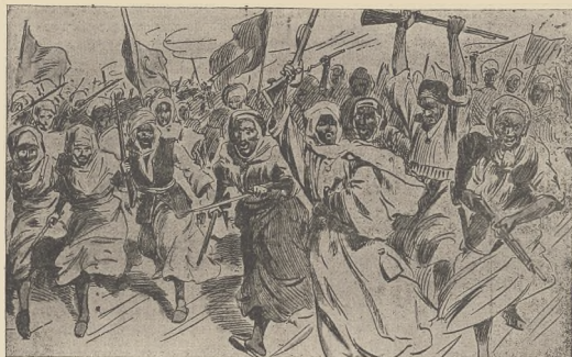
קיינע און רעוואלוציע אין שטאטען: א קאסע פון די קאמילען.

איצט ווערן שוין אויך די רעוואלוציערע בענימ נוט אים נאנען לאנד שטאטער, אבער דאס פאלט אז פון דעם נאנען קיינע נישט צווייטערן און האט קיין חשק, איבערצושטעלן וועט ווען קיין פעלעלע, די לאנד פון דער רענימס און פונם קעניג אז ווער א שווערע.