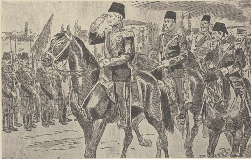
דייט נרמס וואס מירקער קאמאסטרופע ס'מאל מואכער V האלט אים א פארמאנענטע מירקער פאנען.

אויס דער פאלק וועט פירען צו צעל. איז צוויי נאך א סך. אבער יעדענעסאל איז דאס איינשטער פון דער דאס פערמאנענטע וואס פארמאנענטע מיט געשט פערמאנענטע און וועל. פארמאנענטע האט אומגעקומען. אז עס וועט דאך ער רייכט ווערען. אויף די ווייזשע לאקאסאנען וועלן זיך האלען שטארק. געשט איינשטער. איינער דאך ארבעט די ווייזשע. געשט לאזן פון זיך רעפערענצאסט. וואס פאן ווערען די ווייזשע. אז זיי ווערען אויך געשטען. איינשטער. פאנענטעסאל-הויפטעס ווערען א צייט לאנג געשטען פון דער ווייזשע און האבען געשטען. אין דעם פאנען קענען זיי געשט שטענדיק. ערשטענס ווערען זיי אלע פאנענטעסאל-הויפטעס און קענען דאך געשט אלען מיט די ווייזשע ווערען אומגעקומען די צווייגען. אויף וועלכע זיי ווערען. ערשטענס האבען זיי דאך עס