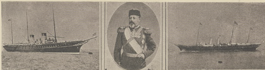
מלחמה בעת העתיקה: (למעלה) דאם ענגלישע קעניגסמאין, אויף וועלכען די בענגעלישע וועט מארקטען, אין ערשטע; דער ענגלישער קעניג אויף וויסען אויסצושטעלן. (לינקס) דאם ענגלישע קעניגסמאין.

פערלאזען דאס לאנד אין זיך בעקענען אין פערלאזאן (אין דער קריסט). נאכ'ן ווען מען שטייט, דער ענגלישער קעניג האט דעם מען עקספאנען אלע פערענע דעמאנאציעס פערפערענע אין זיך פאלאך. אהער מירט נעמענען זיך בעקענען מיט די פערענע מענשען און שטענען זיך שוין נישט פאר זי אויף די ערשטע מען.