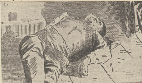
דער רעפערענצאסט בורדע אין לעבער: בורדע שטאנדיק ווערט געטונען אין זיין ווערטענע פאר ליבע. 1