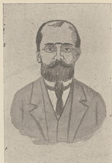
די מדרות איבער הארשטאם: הארשטאם מאָנאָטאָמאָר.

די דריט-ווייטע צייטונגן ביינעגן אויף אויס- פירליכע באמאנאָס פֿון הארשטאם. היינט היינט ער אברהם העקלעלען און אזוי נעבונגן אין פֿינאָס. ער איז נעמקן א דער-ווייטעלען און שפּעטער איבערנעמען אין נימאָנע. עס קעמט אפֿערן נאָך דאָס פֿעל פֿון וועג וועגער-חברות, וועלכע קענען איהם נאָנט נאָם. ברעזען ערעפֿענעלעכע דיוט מעג אין מאַסען. אנאָרעלע מיט נאָמען, דאָס לעצטע וואָרט, אין וועלכען ער פֿערלאָנגט, עס זאל רעווערירט ווערן דער פֿראַגעס קענען דעם נעווענעם עפעס-דאָרט פֿאַר-אויס-נאָמען. לאַס פֿאַר אַן וועלכער איז בעקאָנטער פֿאַר-אויס-נאָמען. נעווערן אויף אַ האַרשטאָם פֿעקען קיין סיביריע, וויל ער האָט אומגעקענט אַוועק און ער, ברעזען זאל מאָנעטען ווערן אלע ערד, נאָמירליך זאל מען איהם נאָרמאָלען, אז עס וועט איהם אין רוסלאַנד קיין שולעכעם נישט נעמען און ער וועט קענען איהם- פֿאַרדען ווערער פֿירי, דעמילע, ביי אַזאָ פֿראַגעס, וועט ער, ברעזען, אַרדווייטען אַלע מעשעס פֿון האַרשטאָם, אזעלכע ראַשקאָוויטש און אַלע מיטלענדיק פֿון דער רוסישער נעווערירט, אויסלאָרד-פֿאַר-אויס און ענדערקען אַלע וועגער.