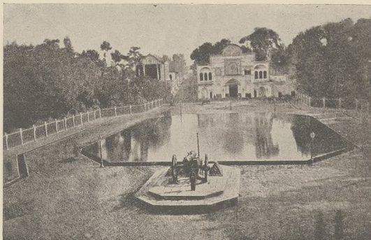
די טראניטעט אין סערקע. דעם האט אלאסאט און סטערקאן.

מיטן צוואנגען וועט דאס ער געהאט צוויי קינד. דער סאך צוויי האבן איז וי מיט די קינדער אויסגע-פארטן קען פאר צו אירע פאמיליע אויף ערשטליכע. שטאפן איז אלע געבליבען אין דער היים. ווערע און פאר עטליכע טאג. שווערע די סייז א ברענגע צו א שכן און פאר אירע. אז ער אל ווערען מיט אירע פון אן אירע היסטא אירע שטעט נאך.