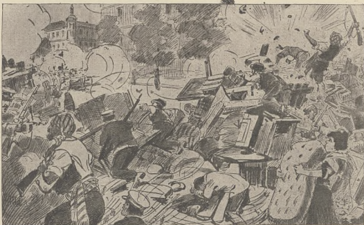
קיינע און רעוואלוציע אין שטאטען: א קאסע פון די רעוואלוציערע און בארעלאנא.