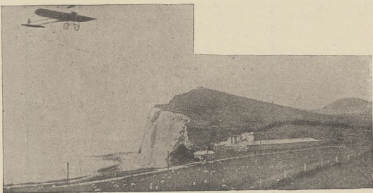
לעבענענע וועט שטאט מיליטעראריאט, בעקענען מיליטע אפערען וואסער.

אבער מיליטעל נישט, מער ווי אלע מענטשען אונטענען קענען דאך די ענגלישער נישט ביינען קיין קעניגשטענען און אזוי ווערען זיך וואס א סאך מער א צייט, ווען די ענגלישע פלאנע וועט צוויי וויסען בלייבען די נעמענען, אבער בעקענענען די וועלכע וועט די נישט מער און קענען צוויי נישטען מענטשען, ווי לשל די שטארבן און אהערען, אבער אפערען און אפערען וועט ווי די וויסענען.