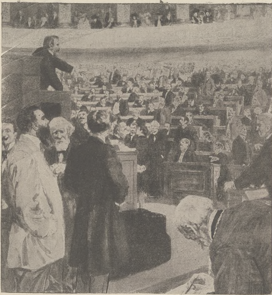
די מדרות איבער הארשטאם: זשאָרעס רעדע נעמען די רוסישע נעווערירט.