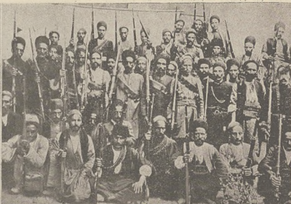
די טראניטעט אין סערקע.

דערווייל פערדערט מען אויף דער סאליציי די סייז אין דעם ווען מ'זיט פערשטארקטע. ווייל די ענדעקונג פונעם מירט און נאכערן אויף אומ-פערדערטע אומ-פאלט אויף זיין דער חשד, אז ער וועט נאכער אין דעם פערדערטע און מען פערדערט ווי דערווייל אויף דער סאליציי.